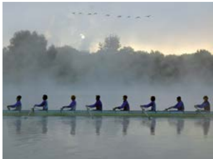
Training auf dem Elfrather See.

Essen & Trinken Sportsbar Karussell, Westparkstraße 102, 0163 / 203 0371