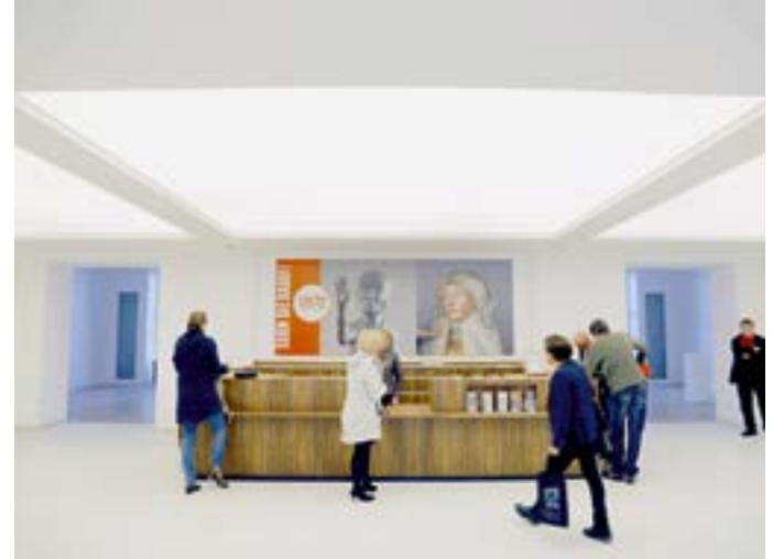
Kaiser Wilhelm Museum.

Essen & Trinken Stadtwaldhaus mit Biergarten, Hüttenallee 108, 0 21 51 / 59 37 84