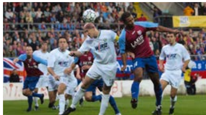
KFC Uerdingen 05.