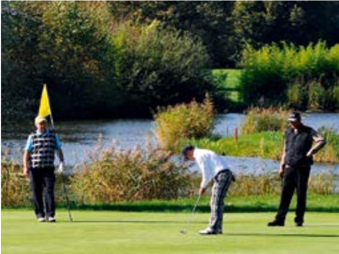
Golfer auf einem der gepflegten Puttinggreens.