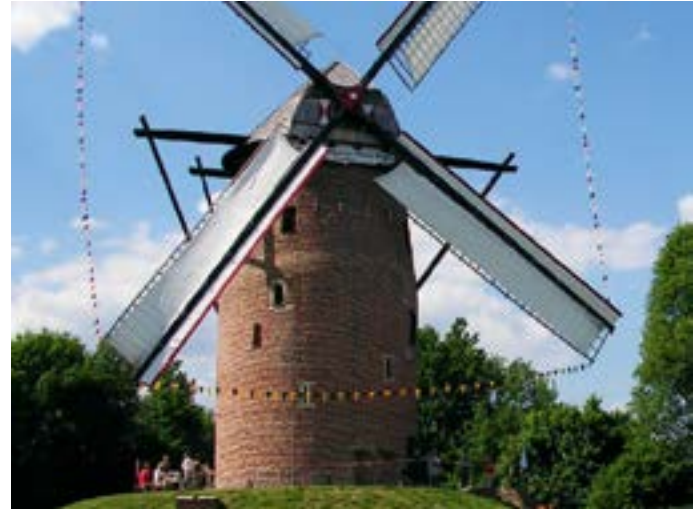
Sommerimpressionen an der Geismühle.

Essen & Trinken Nordbahnhof, Oraniering 91, 0 21 51 / 674 44