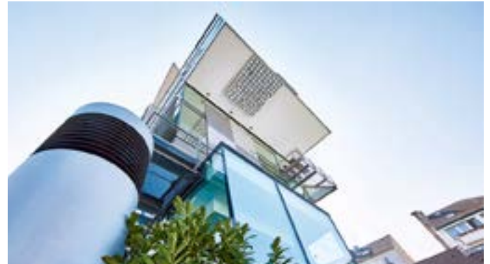
Südsicht des Behnisch-Hauses.