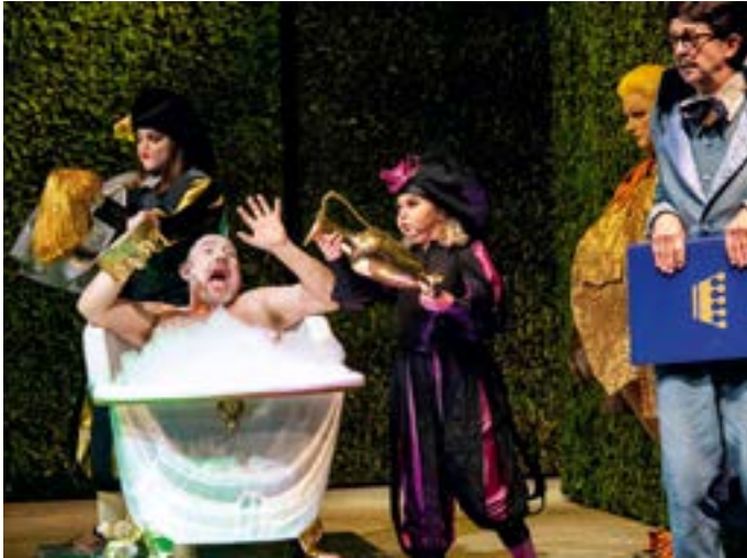
Des Kaisers neue Kleider.