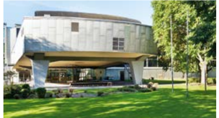
Audimax der Hochschule Niederrhein (Frankenring).

Essen & Trinken Café Paris, Theaterplatz 2, 0157/70339184