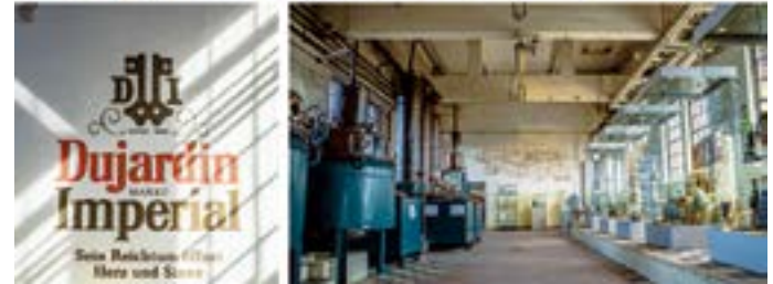
Historische Anlagen der Weinbrennerei.