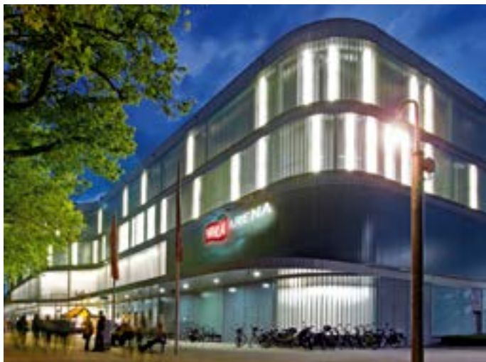
Spielstätte der KEV Pinguine.