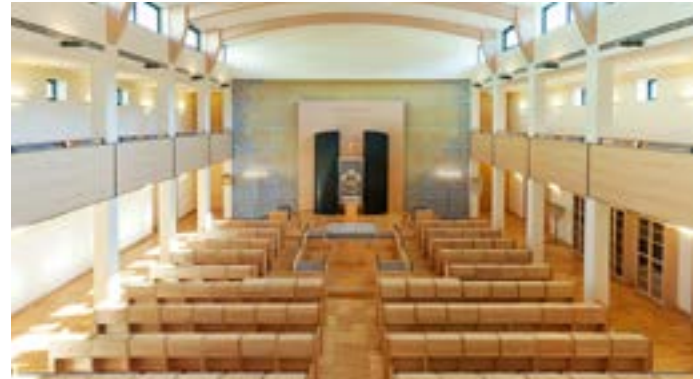
Innenraum der Synagoge.