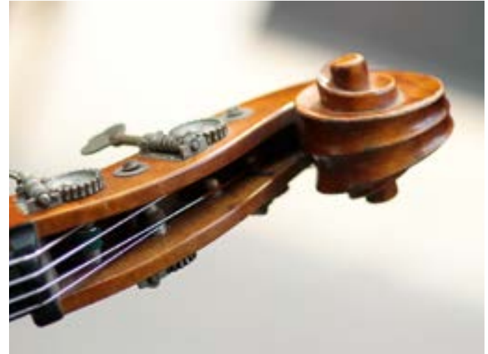
Sinfoniekonzerte im Seidenweberhaus.

Adresse Theaterplatz 3, 02151/8050, Theaterkasse Krefeld, 02151/805125, www.theater-kr-mg.de Essen & Trinken La Romantica, Carl-Wilhelm-Straße 27, 02151/800609