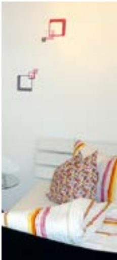
Gästehaus Ambiente.