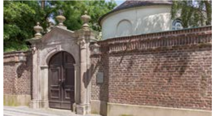
Tor zur Mennonitenkirche.

Essen & Trinken Blauer Engel, Schwertstraße 144, 0 21 51 / 39 34 59