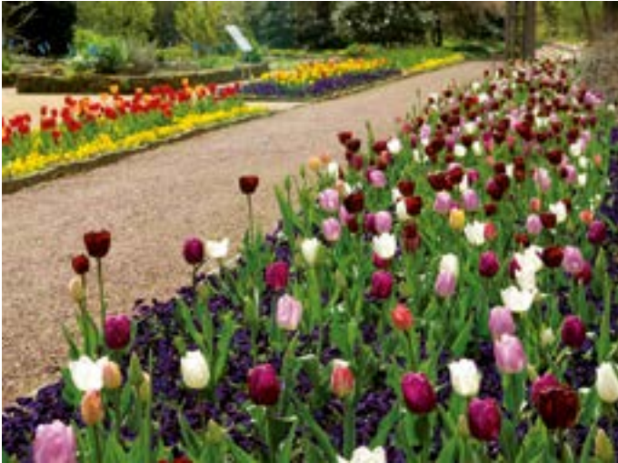
Tulpenblüte im Botanischen Garten.