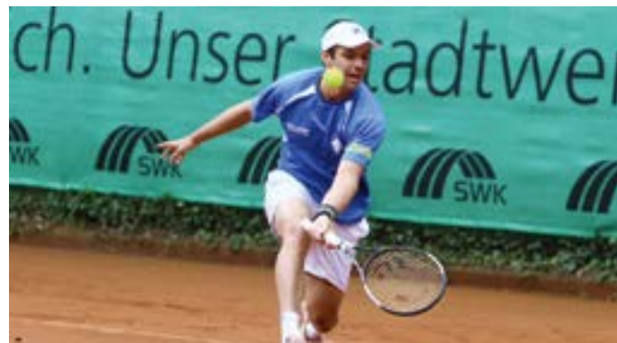
Bundesligaspiel in der Anlage des HTC Blau-Weiß Krefeld.

Haus Kleinlosen, Zwingenbergstraße 116, 0 2151 / 56 13 13