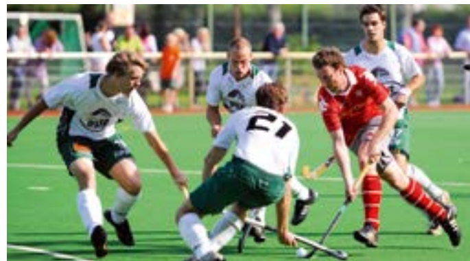
CHTC Hockey- und Tennis Club 1890 e. V.