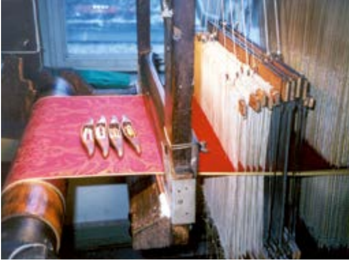
Haus der Seidenkultur.