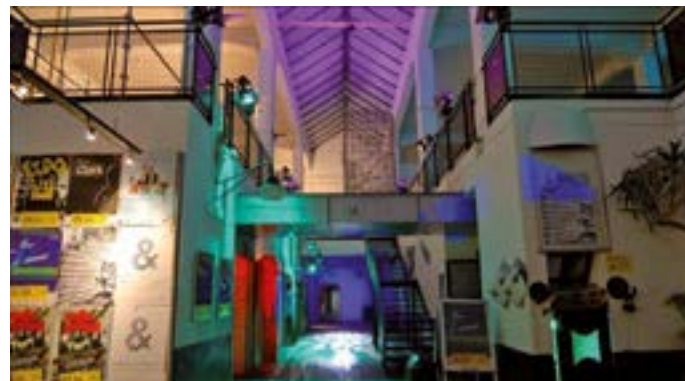
Kulturfabrik Krefeld.