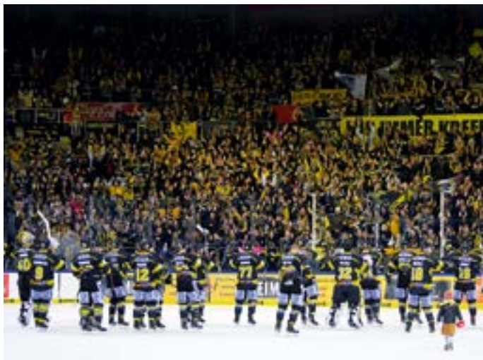
Pinguine auf dem Eis.