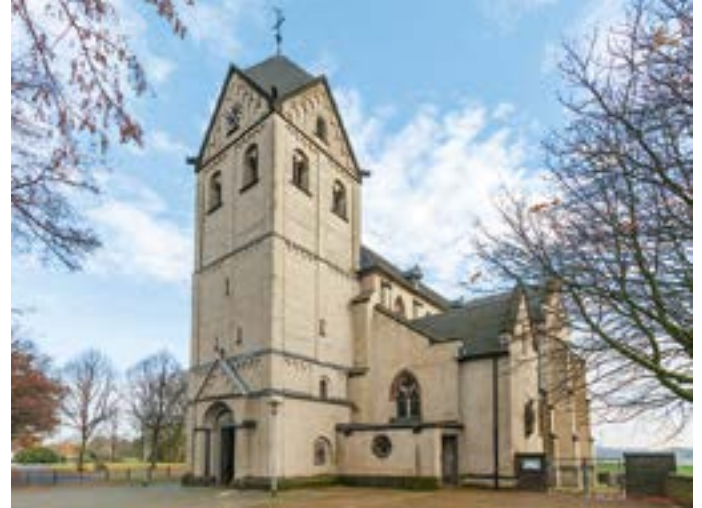
Kirche St. Matthias Hohenbudberg.

Essen & Trinken Café Südlicht, Lewerenzstraße 29, 0 2151 / 985 99 91