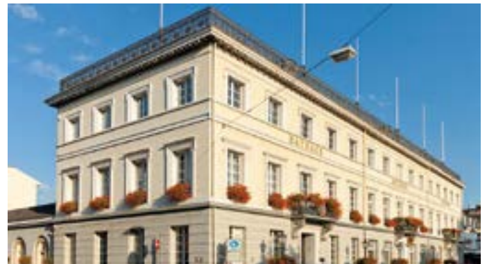
Herberzhäuser in Uerdingen.