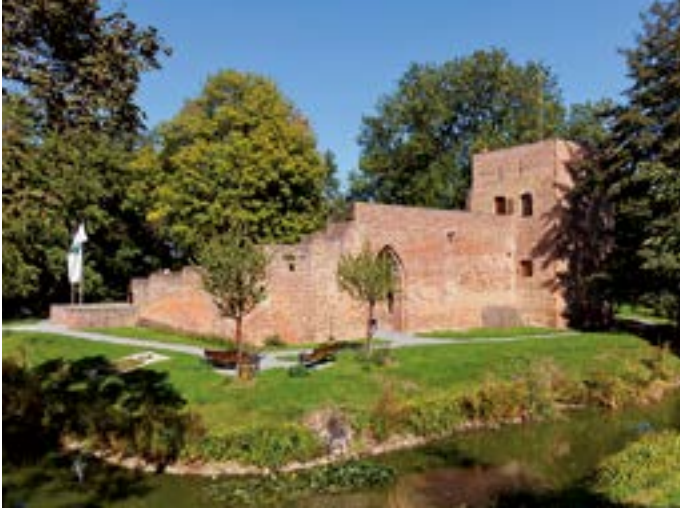
Sommeransicht der Hülser Burg.