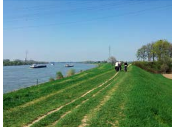
Radtour am Rheindamm.

Information Weitere Informationen zu ausgewählten Wanderwegen und Fahrradrouten erhalten Sie in der Broschürenreihe „Krefeld erkunden“. GPX Tracks stehen unter www.krefeld.de zum Download bereit.