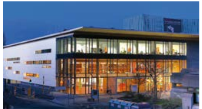
Die Mediothek zur blauen Stunde.