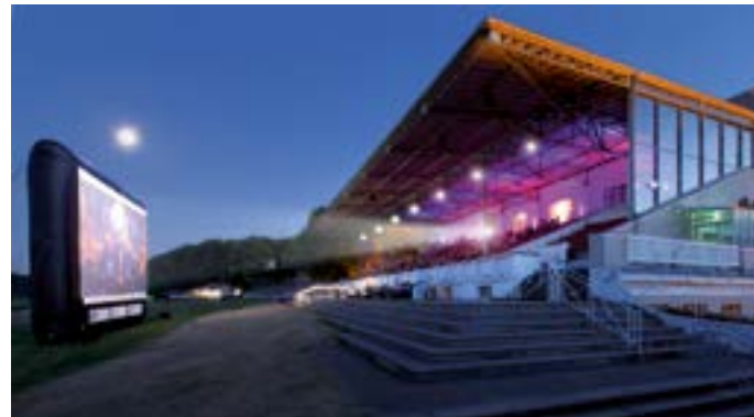
Sommerkino auf der Krefelder Galopprennbahn.

In den zwei Sälen der Kulturfabrik finden neben Konzerten, Festivals, Comedy, Gothic und Rocknächten auch themenbezogene Veranstaltungen, wie die 80er und 90er Partys, Ü30-Veranstaltungen und Singlepartys mit oder ohne DJ statt. Ganzjährig gibt es Live-Auftritte von Solokünstlern, Autoren, Theatergruppen und Kleinkünstlern. Das vielfältige Programm der KuFa lockt Publikum vom gesamten Niederrhein und aus dem Ruhrgebiet nach Krefeld.