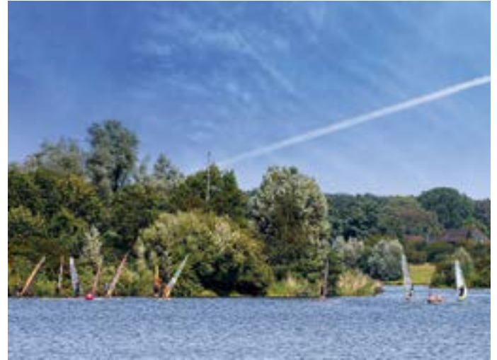
Surfer auf dem Elfrather See.

Essen & Trinken Hülser Bergschänke, Rennstieg 1, 0 21 51 / 56 88 41