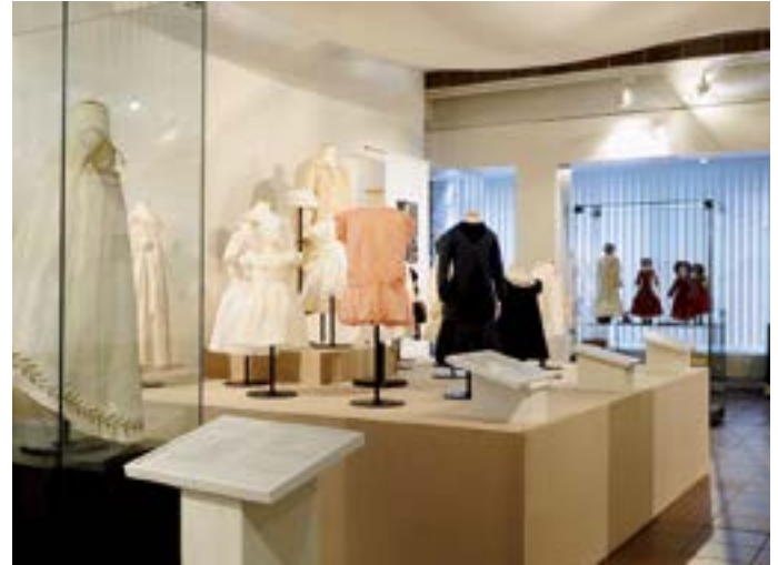
Der Kinder bunte Kleider – Kinderbekleidung aus eigener Sammlung.

Essen & Trinken Museumscafé, Rheinbabenstraße 85, 0 2151 / 48 14 82