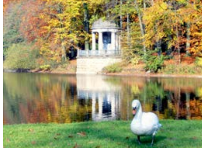
Idylle am Stadtwaldweiher.

Essen & Trinken Derby Restaurant, An der Rennbahn 4, 02151/598451 Restaurant Zeus, Griechisches Restaurant, Sprudeldyk 12