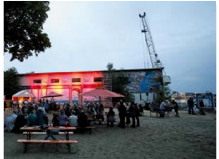
Rhine Side Gallery. Foto © FreddArt Streetpainting

Im Uerdinger Stadtpark ist eine der schönsten Minigolfbahnen Deutschlands beheimatet. Auf dem öffentlichen 18-Bahnen-Kurs wird auch auf Bundesligaebene gespielt. Eine weitere Minigolfanlage befindet sich am Elfrather See.