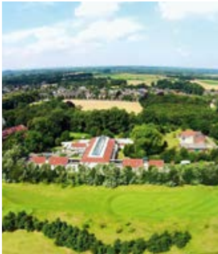
Mercure Tagungs & Landhotel Krefeld.