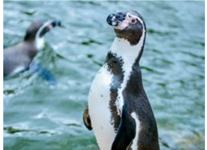
Pinguine im Krefelder Zoo.

Informationen SWK & GSAK ServiceCenter, Ostwall 148, montags bis freitags von 7 – 18 Uhr, samstags von 9 – 14 Uhr Mediencenter Krefeld, Rheinstraße 76 / Ecke Ostwall montags bis freitags 9 – 18 Uhr