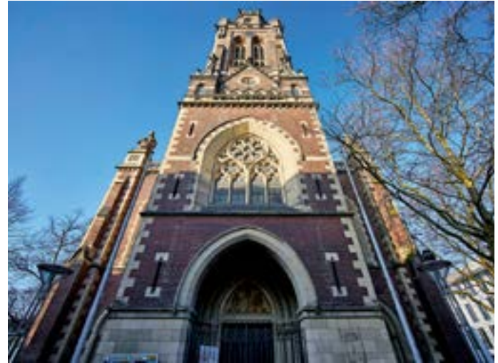
Turm der Dionysiuskirche.

Adresse Wilhelmshofallee 91 – 97, www.kunstmuseenkrefeld.de Öffnungszeiten Geöffnet bei Ausstellungen und bei Sonderveranstaltungen Essen & Trinken Stadtwaldhaus mit Biergarten, Hüttenallee 108, 0 21 51 / 59 37 84