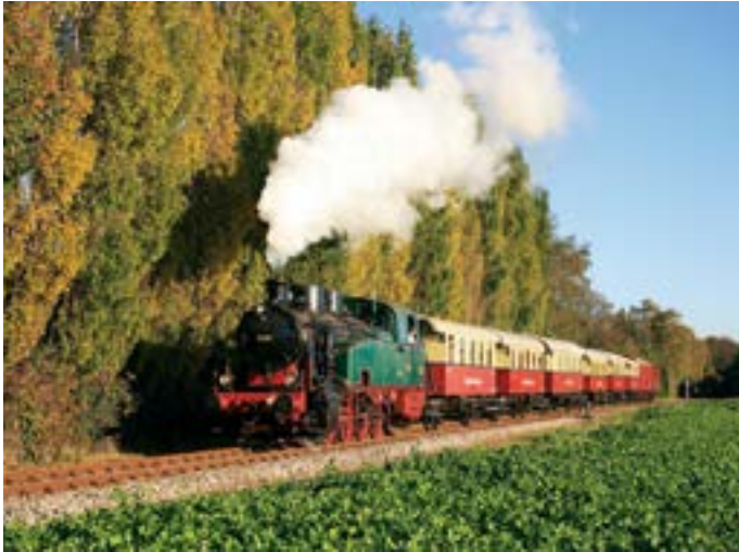
Herbstfahrt mit dem Schluff.