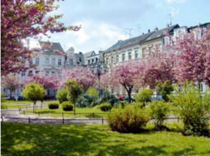
Kirschblüte am Alexanderplatz.