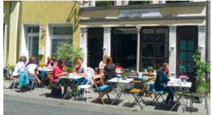
Außergastronomie vor dem Café Liesgen.