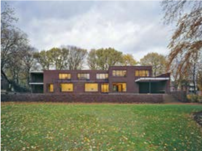
Haus Lange, Krefelder Kunstmuseen, Architekt Ludwig Mies van der Rohe. Foto © Volker Döhne