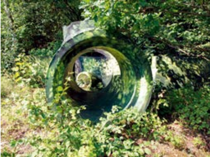
Wood Art Gallery am Umweltzentrum.