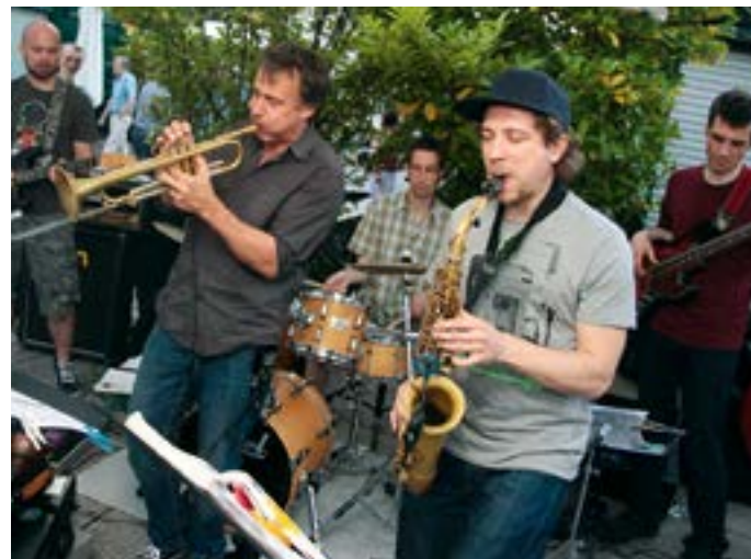
Jazzsession bei Kultur findet Stadt.

Adresse Westparkstraße 111, 0 2151 / 78 100, www.yayla-arena.de Essen & Trinken Sportsbar Karussell, Westparkstraße 102, 0 2151 / 928 57 10