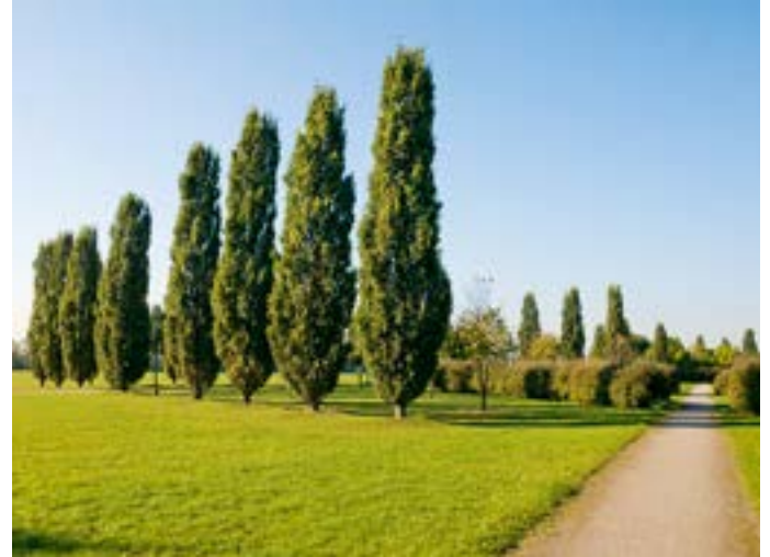
Zypressen im Stadtpark Fischeln.

Essen & Trinken Marcelli, Moerser Straße 649, 0 21 51 / 56 09 74