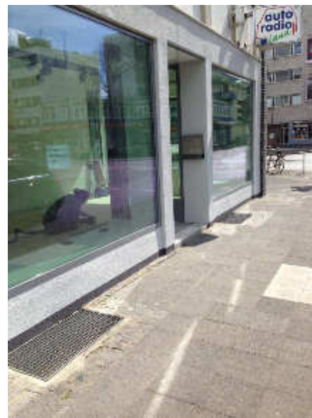
Seite Philadelphiastraße nach der Sanierung