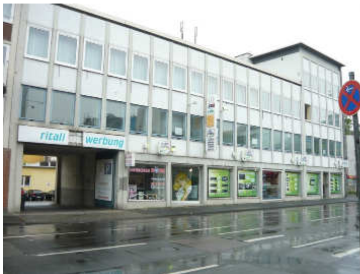
Seite Philadelphiastraße vor Sanierung

Die Bezuschussung der Zoo Krefeld gGmbH fiel im Jahr 2016 geringer aus, da die brandschutztechnischen und wärmeenergetische Sanierung des „Gehlen-Hauses“ seit 2015 im Vordergrund stehen muss. Die erheblichen Ausgaben für diese Maßnahmen führen seit 2015 dazu, dass keine Überschüsse aus den Erträgen erwirtschaftet werden können. Im Jahr 2016 wurden insbesondere auf der Straßenseite „Philadelphiastraße“ die Fenster des Autoradiolandes und der ehemaligen Fahrschule Böhm ausgetauscht. 2017 erfolgen die Sanierungsmaßnahmen auf der Straßenseite „Uerdinger Straße“ und im Bereich des Treppenhauses. Die brandschutztechnische und wärmeenergetische Sanierung wird voraussichtlich Ende 2017 abgeschlossen sein.