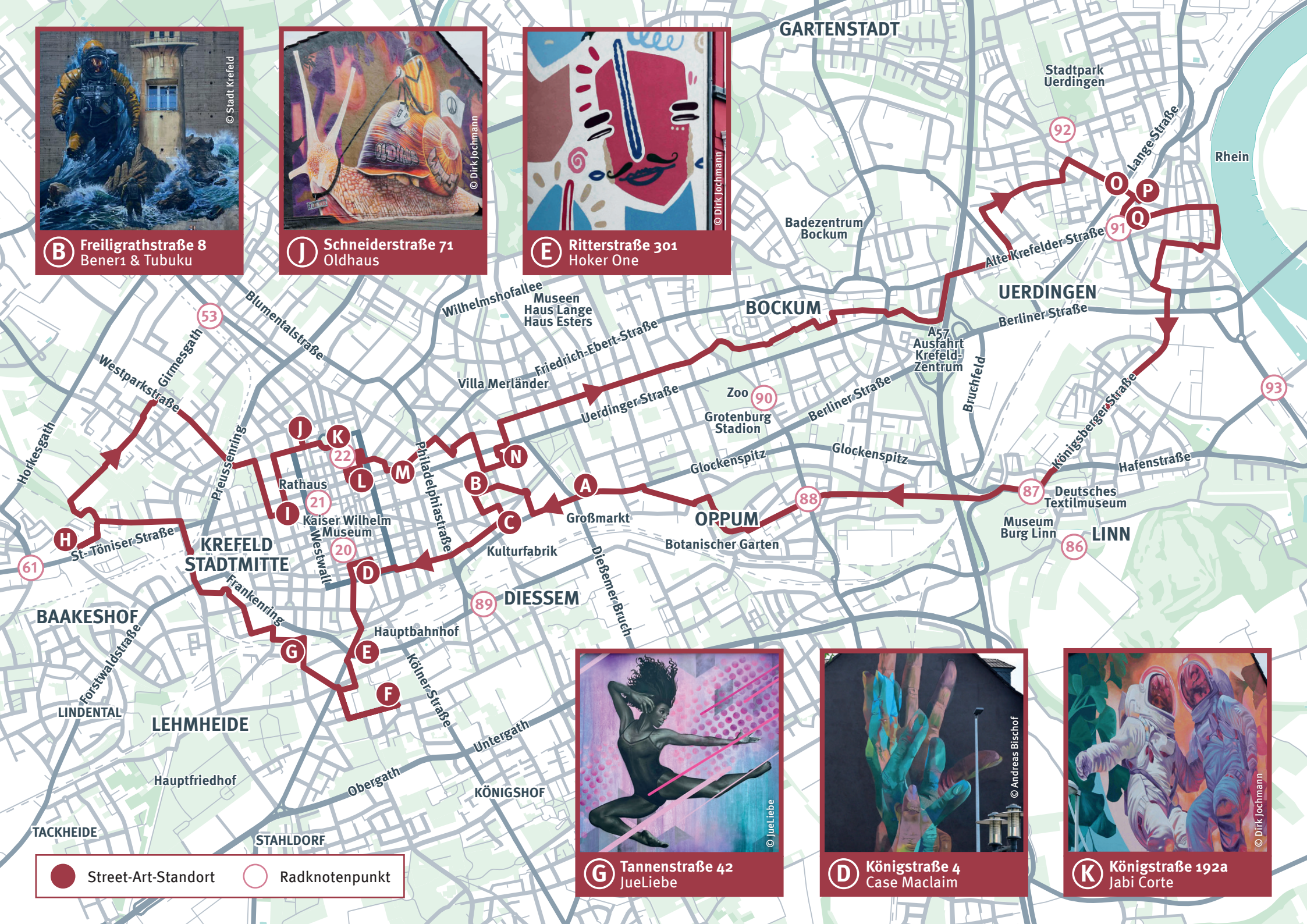
K Königstraße 192a Jabi Corte