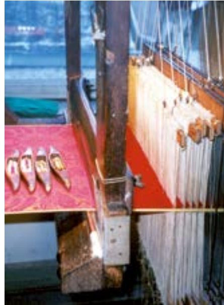
Haus der Seidenkultur.