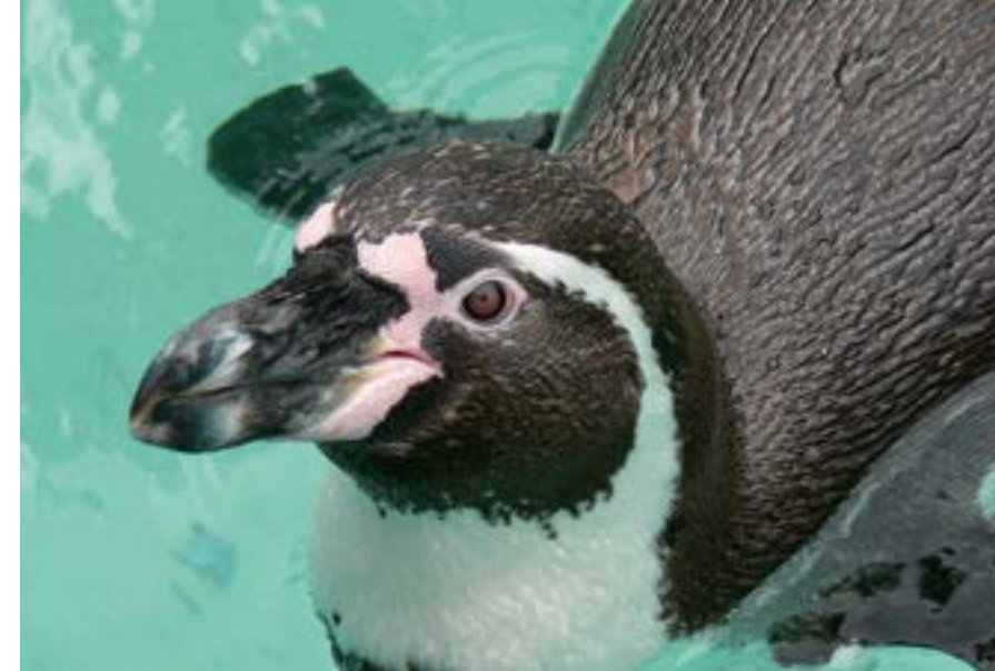
Pinguin im Krefelder Zoo.

Ob Bundesliga Tennis im Stadtwald, erstklassige Golfturniere in Elfrath und Linn, Ruderregatten auf dem Elfrather See, Feldhockey beim CHTC, Wasserball, Rollhockey oder Fußball in der Grotenburg, die Faszination Sport ist in Krefeld hautnah erlebbar.