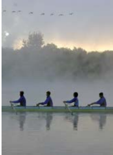
Rudern auf dem Elfrather See.