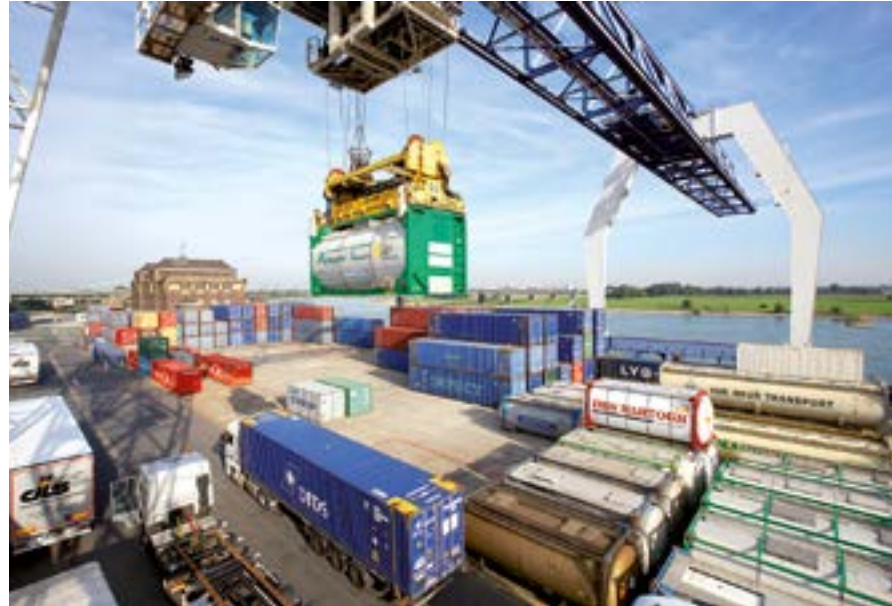
Containerterminal Rheinhafen Krefeld.