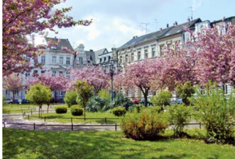
Südstadt Krefeld. Alexanderplatz.