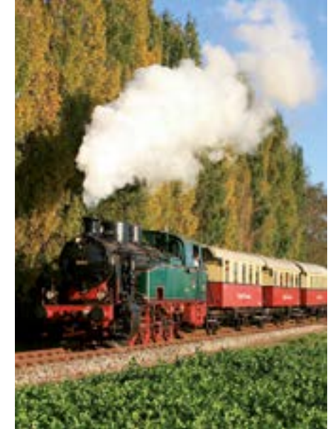
Historische Dampfeisenbahn „Schluff“.

Auch der Galopp-Rennsport hat in Krefeld ein festes Zuhause. Inmitten des idyllischen Stadtwaldes gelegen, kann auf der wunderschönen historischen Rennbahn rund sechs Mal pro Jahr flaniert und auf schnelle Pferde gewettet werden. Im Inneren der Bahn befindet sich zudem einer der insgesamt drei Krefelder Golfplätze. Seine grüne Lage macht auch den Krefelder Zoo zu einem attraktiven Ziel für Besucher von nah und fern. 1938 im Park des Grotenburg-Schlösschens eröffnet, beheimatet er über 1.000 exotische und heimische Tiere aus 200 Arten. Zu den Höhepunkten eines Zoobesuches zählen die neu gestaltete begehbare Pinguinlandschaft, der große Gorillagarten sowie der Schmetterlingsdschungel.