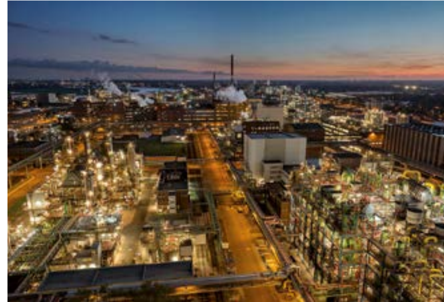
Chempark in Krefeld-Uerdingen.

Zwar ist heute die Textilsparte Krefelds eine Hightech-Sparte, die hochkomplexe technische Textilien entwickelt und produziert. Dennoch stammen nach wie vor die meisten in Deutschland verkauften Krawatten aus Krefelder Unternehmen. Klangvolle Namen der Branche wie Ploenes, Monti, Ascot, Alpi, te Neues, USM und andere haben ihren Sitz in der Samt- und Seidenstadt.