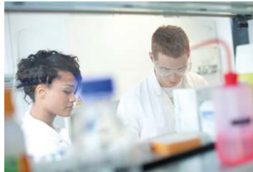
Studierende der Hochschule Niederrhein im Labor.

Forschungseinrichtungen und Unternehmen bilden ein kreatives Krefeld-Netzwerk. Sicherlich ein Grund dafür, dass die Hochschule Niederrhein, ihre Institute und An-Institute regelmäßig beim Forschungs- und Innovationspreis der IHK Mittlerer Niederrhein mit Hauptsitz in Krefeld vordere Plätze belegen.