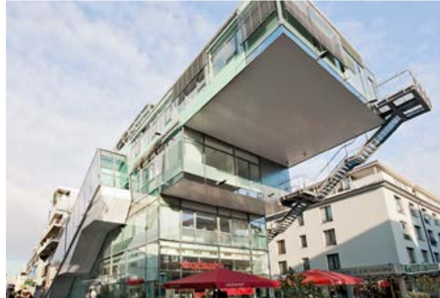
Zeitgenössische Architektur in der Krefelder Innenstadt. Behnisch-Haus.