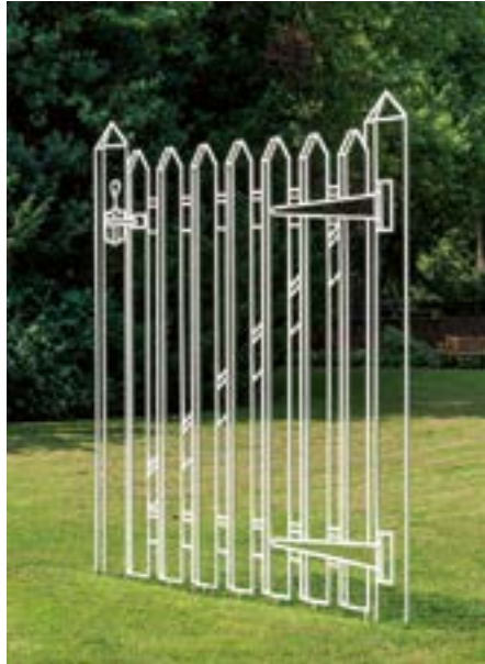
Michael Craig-Martin, Gate (white), 2011 Kunstmuseen Krefeld, Heinz und Marianne Ebers-Stiftung.