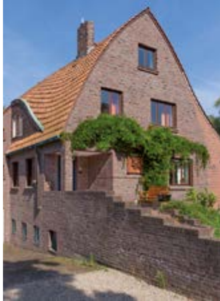
Krefelder Wohnhaus, Architekt Hans Poelzig.