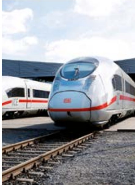
ICE-Züge „made in Krefeld“.