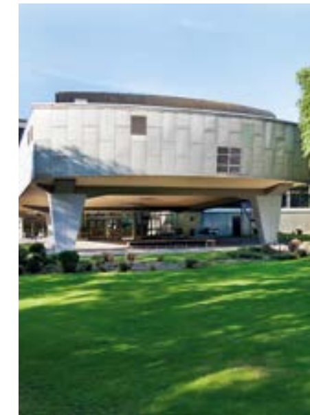
Audimax der Hochschule Niederrhein.

Als Bildungs- und Ausbildungsstandort verfügt Krefeld über ein sehr differenziertes und zeitgemäßes Angebot. Neben der Hochschule Niederrhein steht hier ein Studienzentrum der Fernuniversität Hagen zur Verfügung. Insgesamt vier Berufskollegs flankieren mit einem breiten Spektrum die duale Ausbildung bieten aber auch darüber hinausgehende spezielle Bildungsgänge an. Zusätzlich sind in Krefeld zwei Krankenpflegeschulen sowie eine Lehranstalt für medizinisch-technische sowie pharmazeutisch-technische AssistentInnen ansässig. Und das Helios Klinikum Krefeld ist akademisches Lehrkrankenhaus der RWTH Aachen.