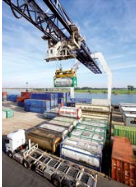
Containerterminal Rheinhafen Krefeld.