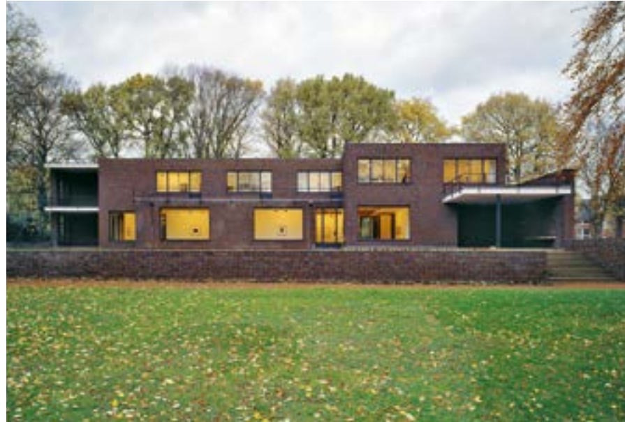
Haus Lange, Krefelder Kunstmuseen, Architekt Ludwig Mies van der Rohe.