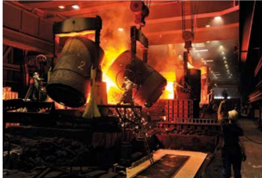
Weltrekordabguss – 320t Flüssigeisen aus 5 Pfannen gleichzeitig.