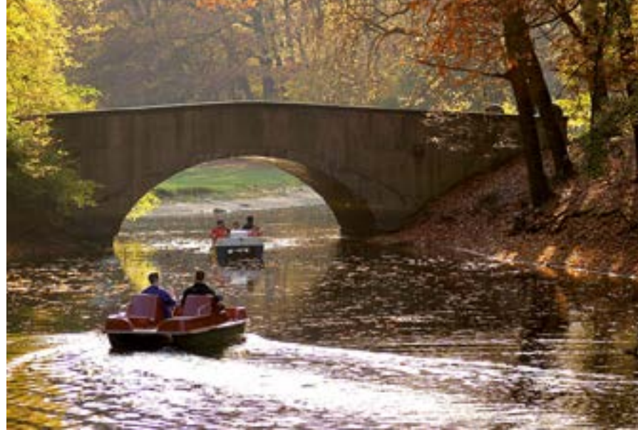
Tretbootfahren im Stadtwald.