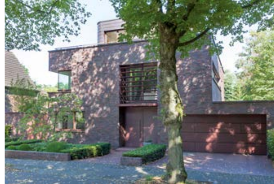
Krefelder Wohnhaus, Krefelder Architekturpreis 2010, Architekt Piet Reymann.

Dank der Montagstiftung Urbane Räume entwickelt sich das Samtweberviertel experimentell und zukunftsweisend als durchmischtes Viertel mit einem lebendigen Gemeinwesen. Motor der Entwicklung ist die ehemalige Textilfabrik „Alte Samtweberei“. Hier entstehen neue Wohnungen im denkmalwerten Bestand, Büro- und Atelierräume sowie Angebote zur sozialen und kulturellen Begegnung.