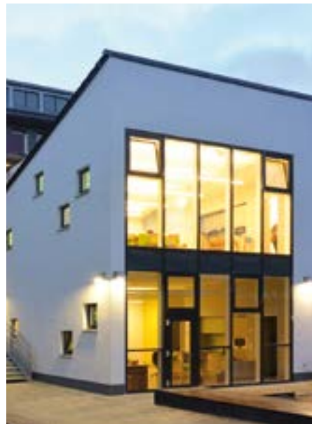
Kita am Westwall ausgezeichnet mit dem NRW-Kita-Preis.