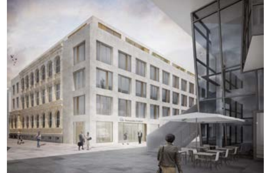
Neubau „Verwaltungsgebäude Wohnstätte Krefeld“ in der ehemaligen Werkkunstschule.

Die exklusive Königstraße präsentiert nicht nur einen attraktiven Mix aus hochwertigen Geschäften. Dank des 520 Meter langen, illuminierten Glasdachs bleibt die Einkaufsfreude auch bei Regen ungetrübt. Rund ums Jahr locken attraktive Veranstaltungen wie Kultur findet Stadt(t), Märkte für Genießer, Pottbäckermärkte und Einkaufen bei Kerzenschein ein überregionales Publikum zum Einkaufen und Genießen in die Innenstadt.