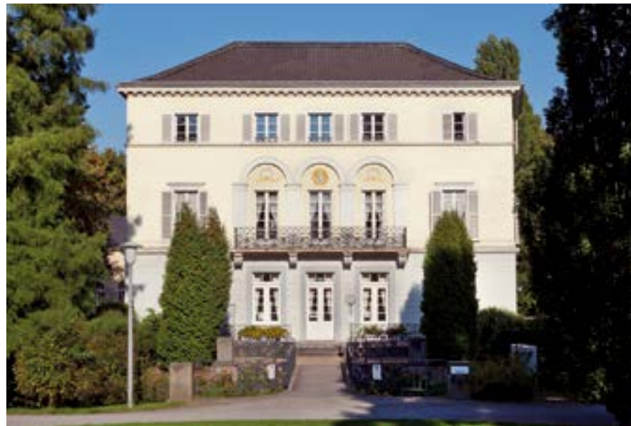
Musikschule in Krefeld – Haus Sollbrüggen.