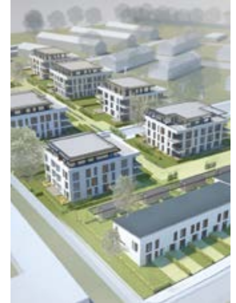
Wohnbauprojekt in Krefeld-Gartenstadt.

Neben der facettenreichen Innenstadt tragen Ortsteile wie Hüls, Uerdingen, Fischeln, Linn, Forstwald, Bockum, Verberg oder Traar zum besonderen Charme der Wohnstadt Krefeld bei. Das ganze Stadtgebiet wird durch einen Grüngürtel umschlossen, den ein dichtes Radwegenetz durchzieht.