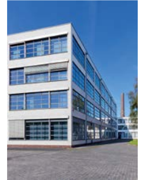
Mies van der Rohe Business-Park.

Dank einer besonderen Melange aus Pioniergeist, Ingenieurleistungen und mittelständischer Fortune entwickelten sich zahlreiche Krefelder Unternehmen durch einzigartige Innovationen in ihren Branchen zu Weltmarktführern. So stammen aus dem Chempark (ehemals Bayer-Werk) in Krefeld-Uerdingen sowohl die Farbpigmente für den Anstrich des Eiffelturms als auch der Hightech-Kunststoff Makrolon. Als Trägermaterial für CDs revolutionierte er die Musikdatenspeicherung und bedeutete das Ende der Schallplatten-Ära. Aber auch wer im Hochgeschwindigkeitszug quer durch Deutschland reist, sitzt ebenfalls in einem Produkt „made in Krefeld“. Denn der bekannte ICE stammt aus dem Krefelder Werk der Firma Siemens.