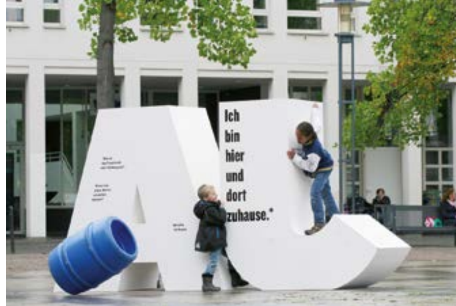
Projekt „Sprachbarrieren“, Fachbereich Design Hochschule Niederrhein.