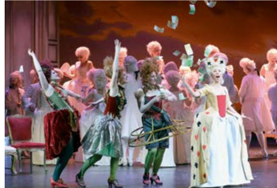
Manon – Oper im Stadttheater Krefeld.