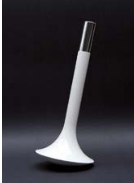
ESNC CREFELD Flakon-Design 2014.